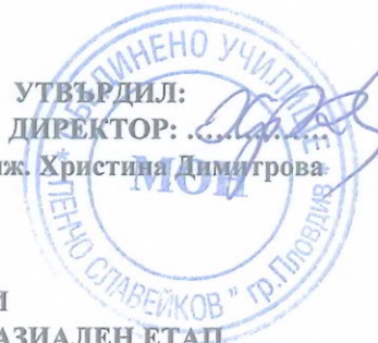
ГРАФИК ЗА ПРОВЕЖДАНЕ НА СРЕЩИ С РОДИТЕЛИ НА ПРЕПОДАВАТЕЛИТЕ В ПРОГИМНАЗИАЛЕН И ГИМНАЗИАЛЕН ЕТАП ЗА УЧЕБНАТА 2020-2021 ГОДИНА – I СРОК